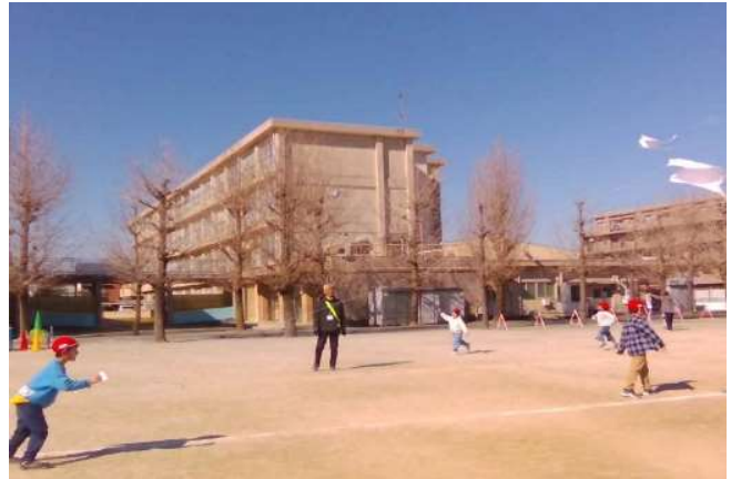
〔1年生 冬を楽しもう〕