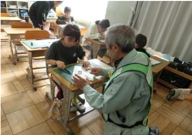
〔 図画工作 補助 〕