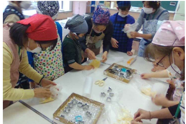
〔 なかよし クッキーづくり 〕

6年生の校外学習では、コース別に分かれて行う活動の各ポイントに常駐していただき 移動の際の安全や 施設内の活動の見守りをさせていただきました。